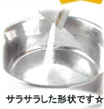
サラサラした形状です☆