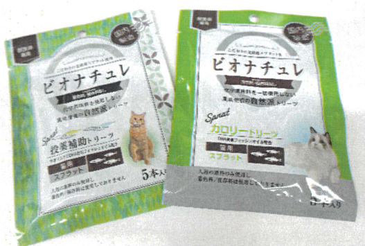
投薬補助と栄養補給の2種類