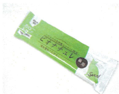
使いやすい スティックタイプ♪