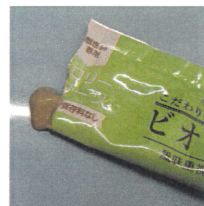
中身はクリーム状で お魚の香りが食欲を 刺激します◎